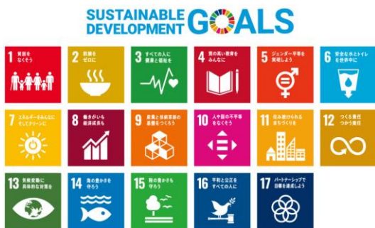
秋田県SDGsパートナー登録数の推移

「秋田県SDGsパートナー登録制度」は、SDGsの達成に取り組む県内企業や団体などを登録・PRする制度で、官民一体となってSDGsを原動力とした持続可能な地域社会の実現を図ることを目的としています。