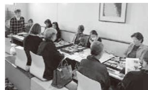
総会で全議案を承認