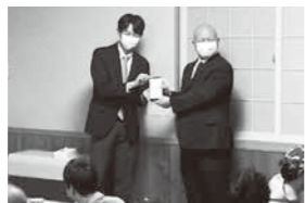
卒業部員への記念品贈呈