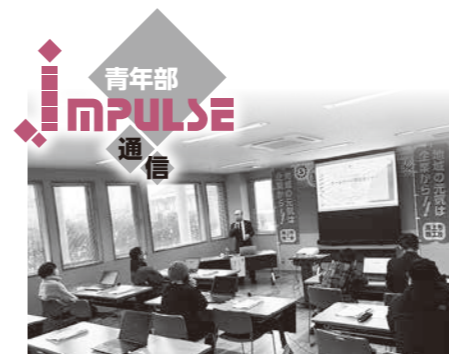
ゲーペ導入研修会の様子

会員皆様のご協力とご理解を心からお願いし、皆様のご健康と益々の商売の発展を願い、本年が皆様にとって素晴らしい一年となることを願い、新春のあいさつとさせていただきます。