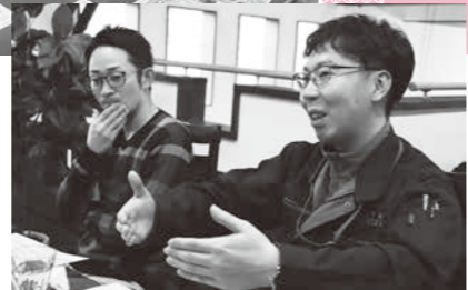
お互いに立場は違えど、若手ならではの観点で意見交換