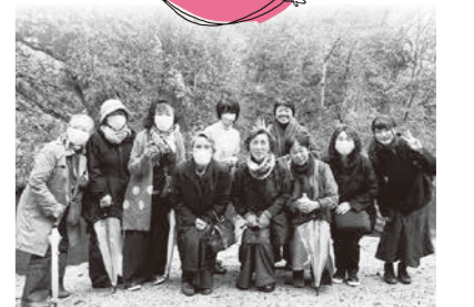
岩手県・狛鼻溪にて