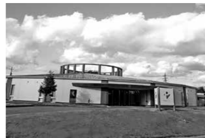
秋田 BPO メインキャンパス 外観