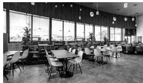
秋田 BPO メインキャンパス カフェテリア